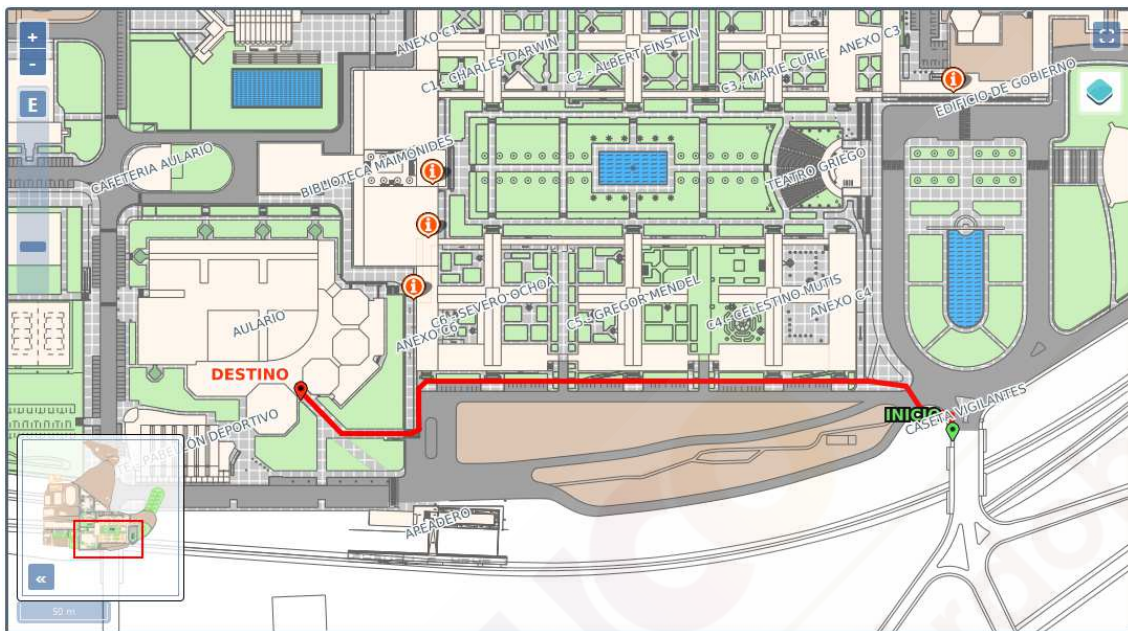
Ruta ejemplo por el Campus de Rabanales.