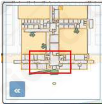
Plano de referencia.

En la parte inferior izquierda podrás observar también un plano de referencia que te indicará con un cuadro rojo la parte que estás viendo ampliada, para tener siempre una referencia. Se puede ocultar usando el botón "«" situado junto a él.