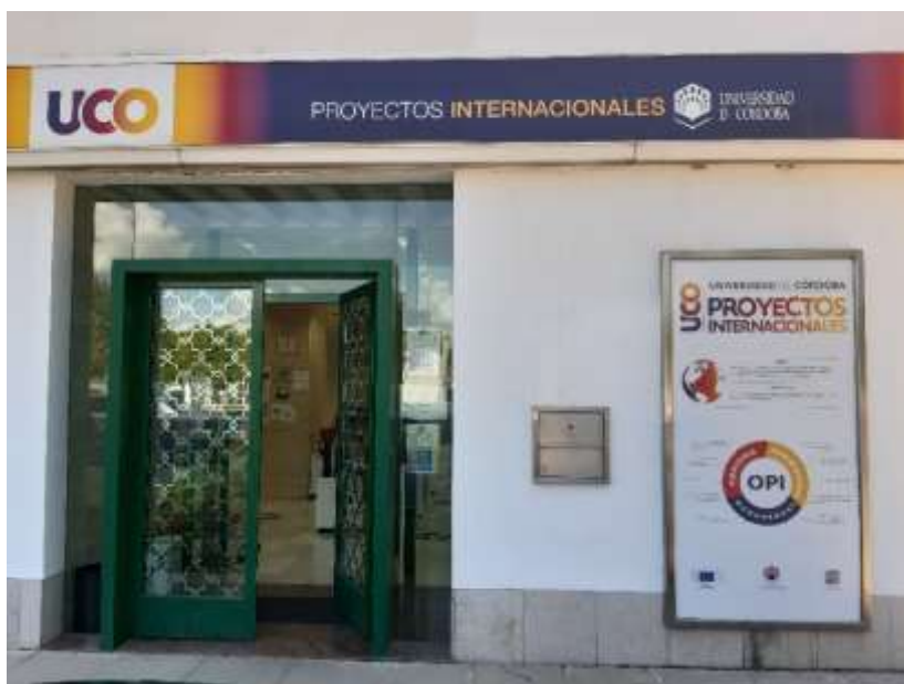
Ilustración 1: Instalaciones de la Oficina de Proyectos Internacionales en el Campus Universitario de Rabanales, curso 2023-2024

Internacionales al Programa Trébol de la UCO , a través de la acreditación del Nivel 1. De esta manera, se ha reconocido la implantación de buenas prácticas en nuestro servicio en relación con el compromiso medioambiental de la UCO.