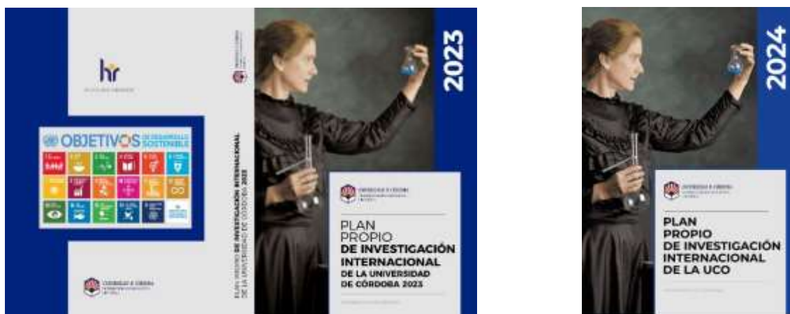
Ilustraciones 2 y 3: Plan Propio de investigación internacional 2023 y 2024

Dado su carácter anual, durante el curso académico, la comunidad investigadora pudo contar con el primer y segundo Plan Propio de Investigación Internacional de la UCO.