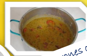
Camarones con coco