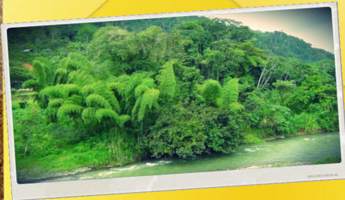
El territorio y sus productos

Las mujeres son las guardianas del conocimiento local y de la biodiversidad a través de su COCINA