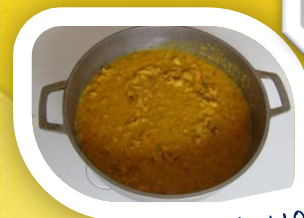
Sudado de toyo