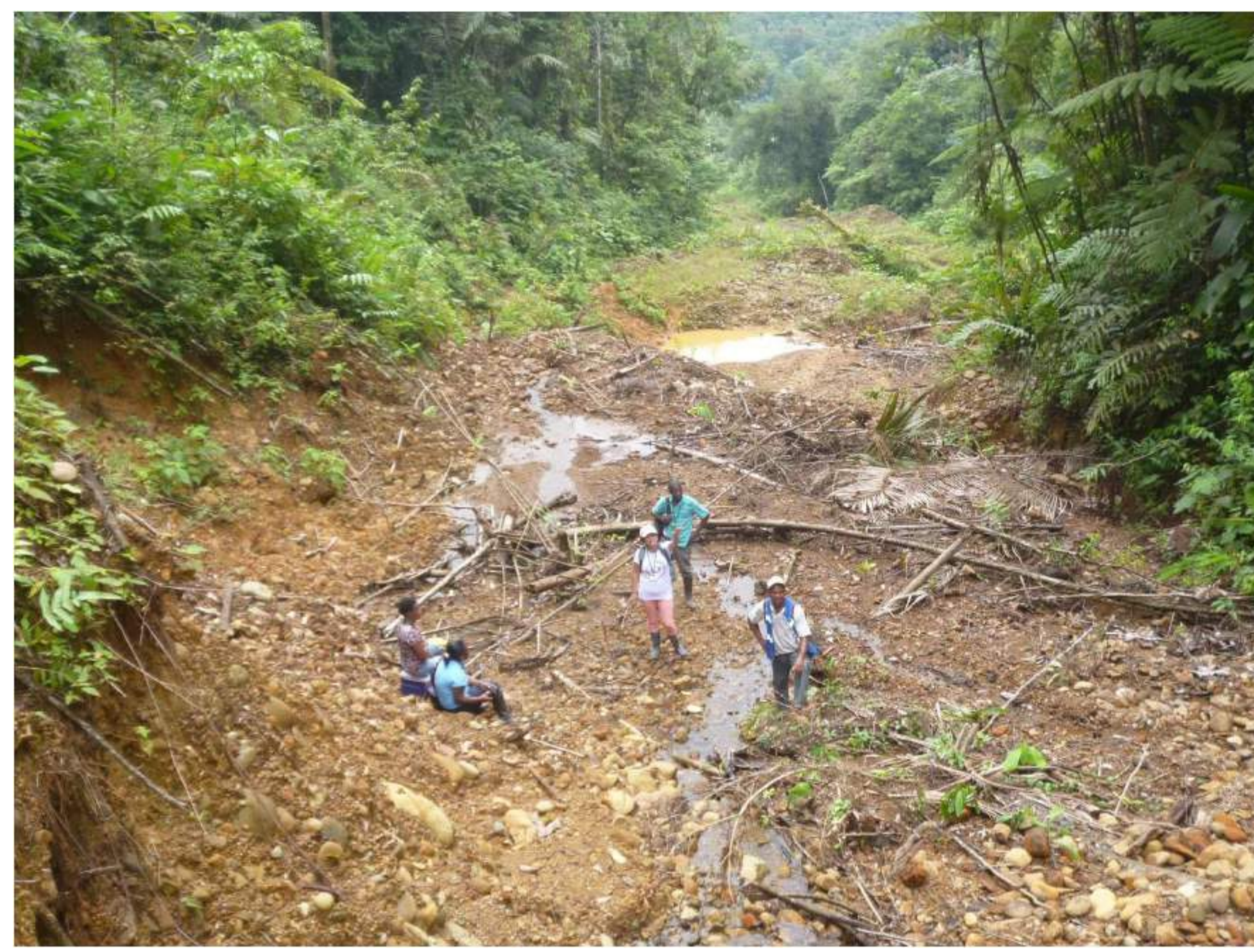
Ganadora del concurso en Colombia