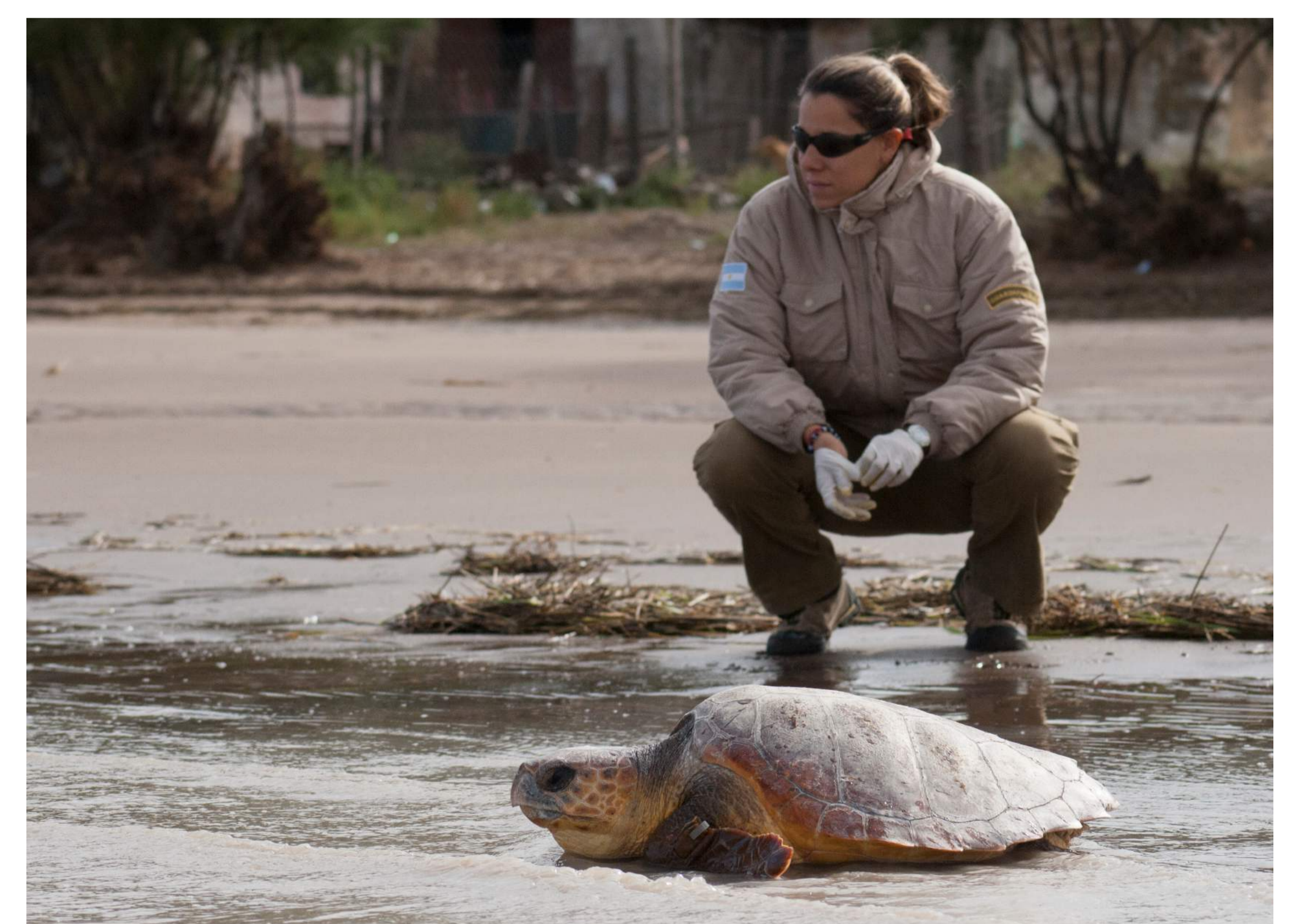
Ganador del Concurso en Argentina

La investigación es muy importante para la conservación del Estuario. Por ello, la boya de monitoreo instalada por el CONICET mide la contaminación del agua. Por otro lado, los vecinos abogan por la construcción de un camino que una las poblaciones de Pehuen Co y Montehermoso; mientras los profesionales de la Reserva Natural Bahía Blanca, Bahía Falsa, Bahía Verde y la Reserva Natural Islote de la Gaviota Cangrejera trabajan con un programa de rescate de fauna para salvaguardar a especies en peligro de extinción.