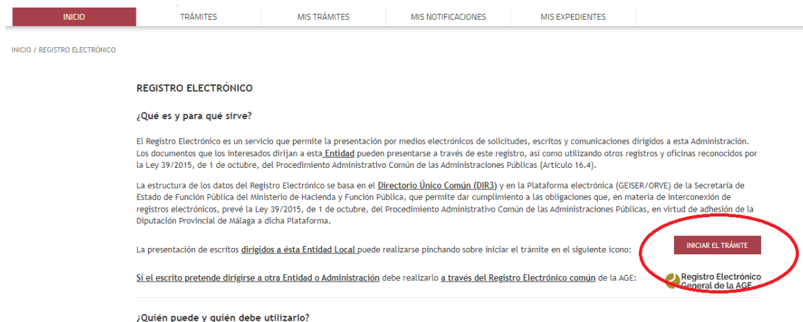
Illustration 9: Processing the formality • Choose the personal identification method that you are going to use: