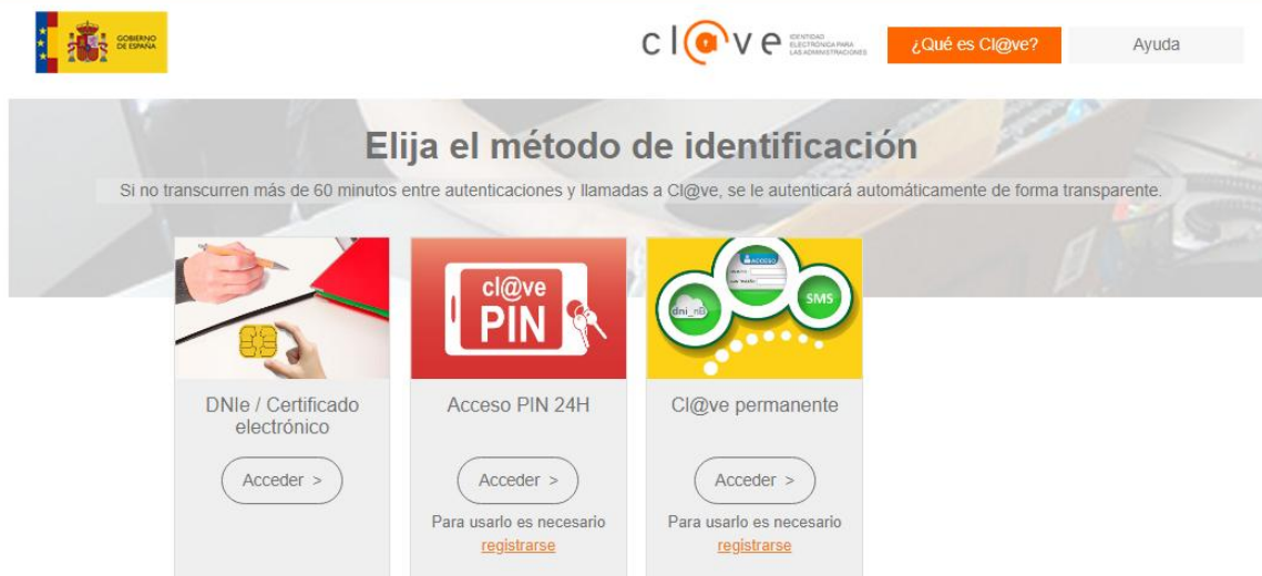
Illustration 10: Personal Identification Method