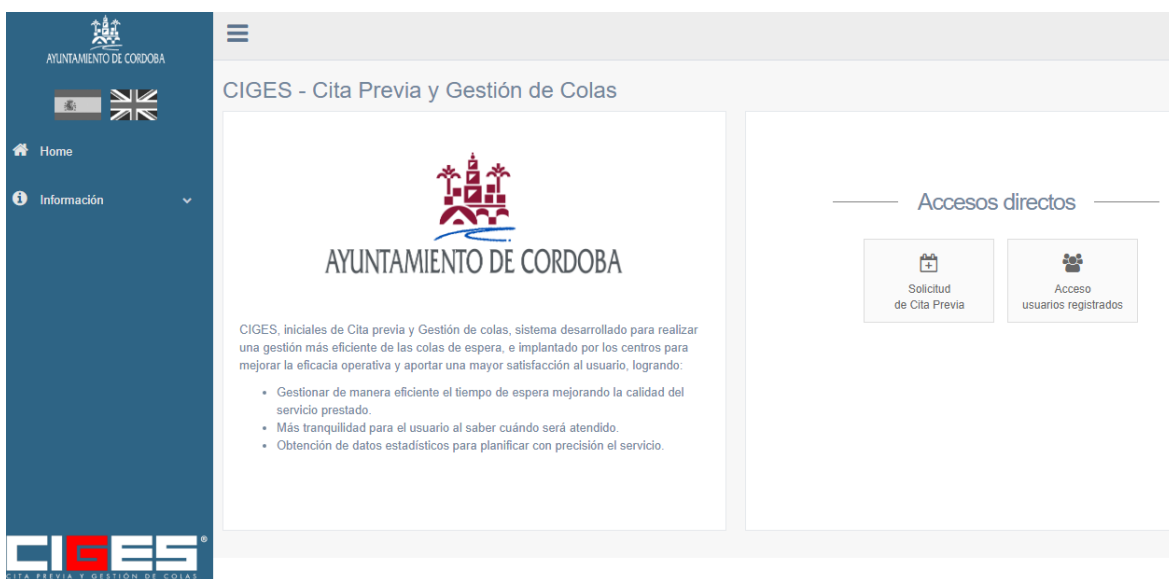
Illustration 2: Previous appointment