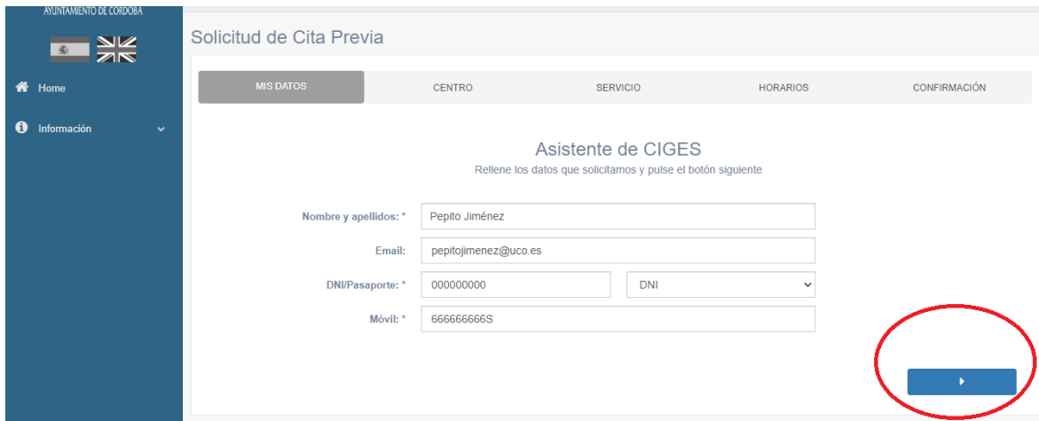
Illustration 3: Appointment Request Wizard