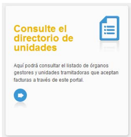
Ilustración 1: Acceso al directorio de unidades

Los organismos que están dados de alta están recogidos en el DIRECTORIO DE UNIDADES. Dicho directorio es accesible desde la home del portal de proveedores.